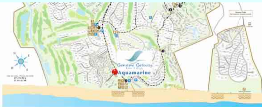
Vale Do Lobo